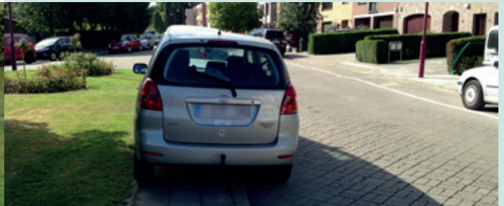
Stationnement sur un trottoir / Parkeren op een voetpad