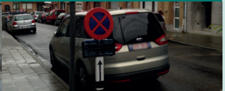
Stationnement sur des emplacements réservés / Parkeren op voorbehouden plaatsen