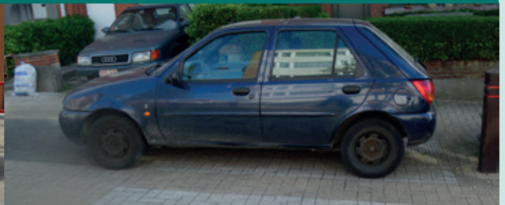
Stationnement sur un passage pour piétons / Parkeren op een oversteekplaats voor voetgangers