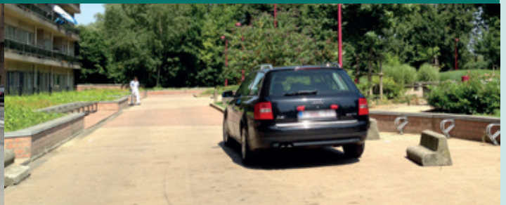
Entrave au passage des véhicules de secours / De vrije doorgang van de hulpdiensten hinderen

Nochtans vindt het algemene politiereglement er geen doekjes om. Wie de bepalingen van dit artikel overtreedt, wordt bestraft met een administratieve geldboete van maximaal 280 euro.